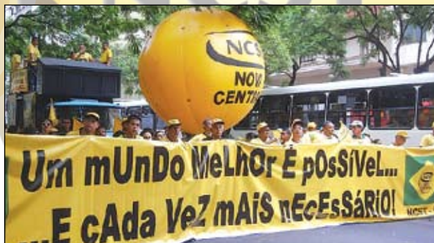
Dirigentes sindicais durante a Marcha de Abertura do FST, em Porto Alegre

Durante a realização do Fórum, a Nova Central realizou o seminário sobre saúde ocupacional, no dia 26 de janeiro, com o tema: "Trabalho, Saúde Ocupacional e Cidadania". Entre os assuntos abordados, Saúde e precarização do trabalho; Saúde ocupacional e organização no trabalho; Saúde e trabalho, direitos de cidadania e apresentação dos vídeos 'Uma Jornada